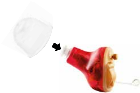
Figure 2 Clipper l'embout sur ORISON

Maintenez l'appareil entre vos doigts et tirez délicatement sur l'embout pour le séparer du trou d'évent, comme indiqué sur la figure 3.