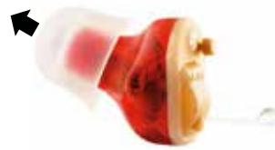
Figure 3 Retirer l'embout d'ORISON