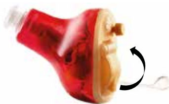
Figure 1 Ouverture du boîtier pile

Si vous ne pouvez pas fermer la porte du boîtier pile, vérifiez que cette dernière est correctement installée, puis réitérez l'opération.