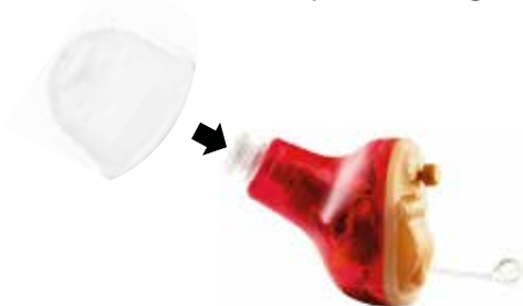
Figure 2 Clipper l'embout sur ORISON

Maintenez l'appareil entre vos doigts et tirez délicatement sur l'embout pour le séparer du trou d'évent, comme indiqué sur la figure 3.