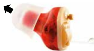
Figure 3 Retirer l'embout d'ORISON